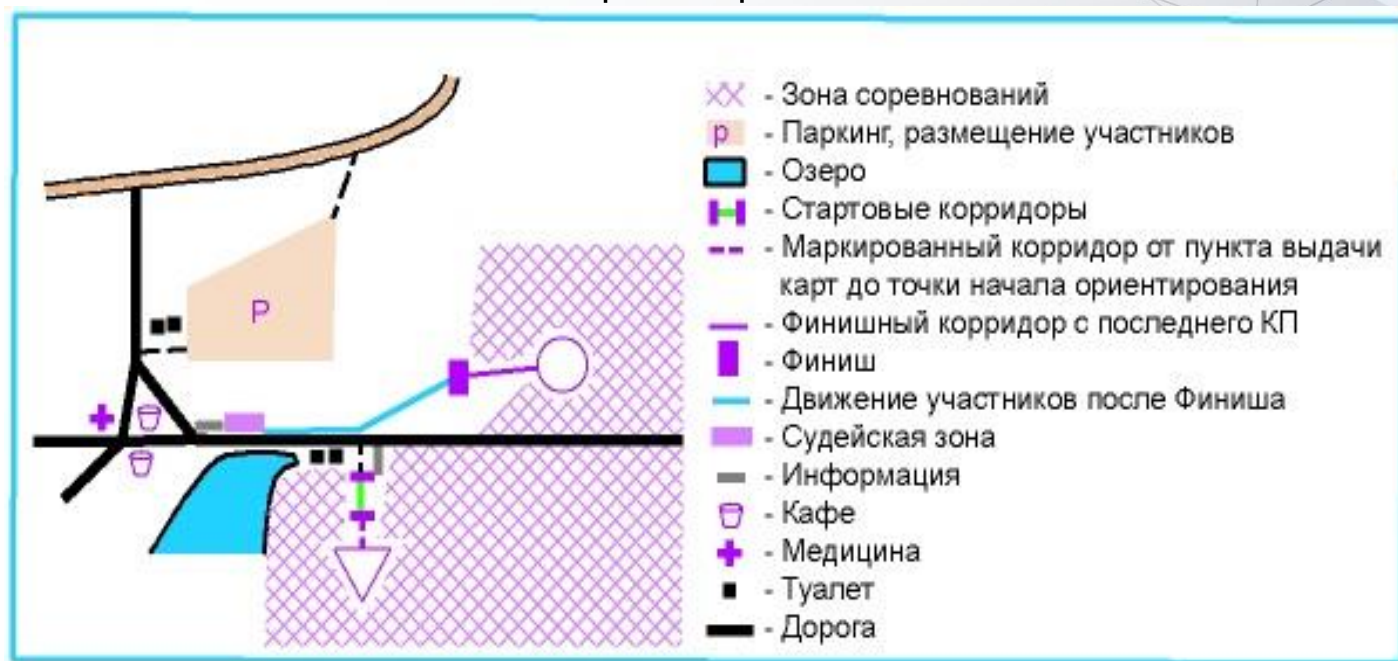
Схема арены соревнований: