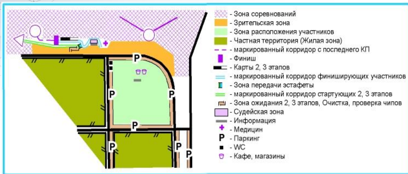
Схема арены соревнований: